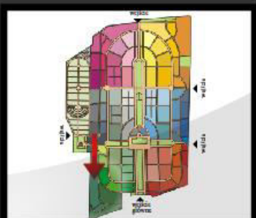
ogólny plan cmentarza (zaznaczony sektor LA7)